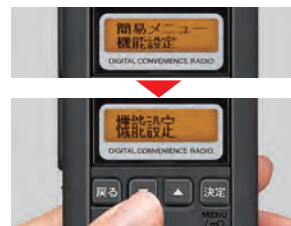
縦倍角メニュー表示

4つのキーによるカンタン操作で、いろいろな機能設定が可能。漢字対応の液晶画面では大きいフォント4文字でチャンネル番号を表示します。よく使う機能設定は最大6文字表示、さらに見やすさを優先した縦倍角表示に切替設定できます。